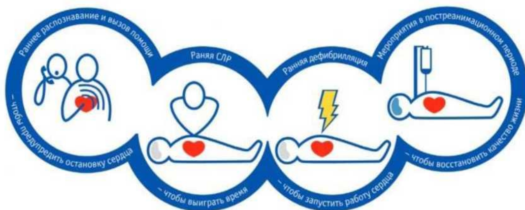
Рис. 1 - Принципиальные элементы реанимационного алгоритма

В условиях, когда недоступен мониторинг сердечного ритма, ВОК диагностируют в течение не более 10 сек. по следующим признакам: