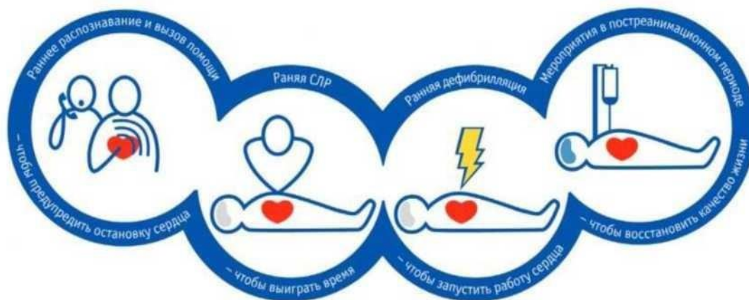
Рис. 1 - Принципиальные элементы реанимационного алгоритма

В условиях, когда недоступен мониторинг сердечного ритма, ВОК диагностируют в течение не более 10 сек. по следующим признакам: