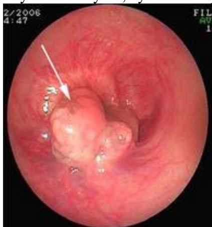
Рис. 1. Эндоскопическая картина

R-грамма пищевода с контрастным веществом: нарушение структуры рельефа слизистой оболочки пищевода, отсутствие перистальтики стенки пищевода, дефект наполнения, тень опухолевого узла, сужение в средней трети пищевода (рис. 2).