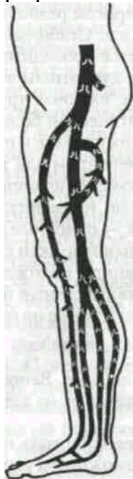
Рис. Локализация клапанов в венах нижней конечности

деятельность венозных клапанов, так как при возникновении ретроградного рефлюкса крови створки клапанов смыкаются и ток крови прекращается.