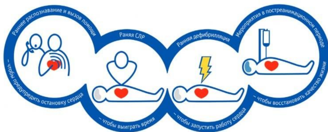
Рис. 1 – Принципиальные элементы реанимационного алгоритма

В условиях, когда недоступен мониторинг сердечного ритма, ВОК диагностируют в течение не более 10 сек. по следующим признакам: