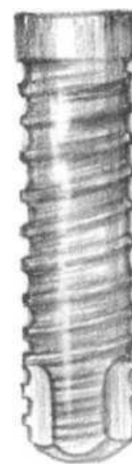
Рис. 2. Винтовой имплантат

Классический вариант имплантационной конструкции с резьбой предусматривает одинаковый диаметр тела имплантата по всей его длине «Вгапешагк». Другие модификации винтовых имплантатов оформляются конически сужающимися к верхушке (в частности, «Frialit-2» и «Replace»). Выпускаются конфигурации имплантатов, у которых сам корпус выполнен в виде конуса, а резьба имеет переменную, увеличивающуюся глубину, так что наружный контур ее витков образует цилиндрический профиль. Примером являются имплантаты «Ankylos» и «Pitt-Easy Bio-Oss». Существуют винтовые имплантаты со сложной формой внутрикостной части, например, в виде эллипса у марки «Steri-Oss».